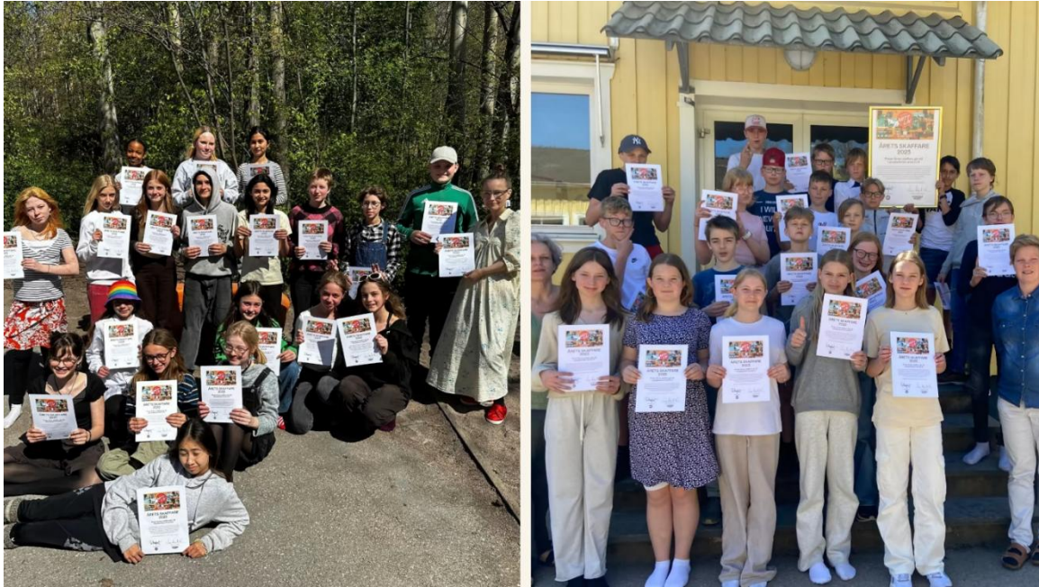
Vinnarna av Årets skaffare 2023. Till vänster: Klass 6 Entréskolan, Stockholm. Till höger: Klass 6 Ljungbyskolan, Falkenberg.

Under åren 2021–2025 delades priset ut för uppgiften En dag i mitt liv . Sommaren 2026 lanserar vi ett nytt tema som priset 2027 kommer att delas ut för. Det nya temat kommer då att handla om demokrati. Så håll utkik!