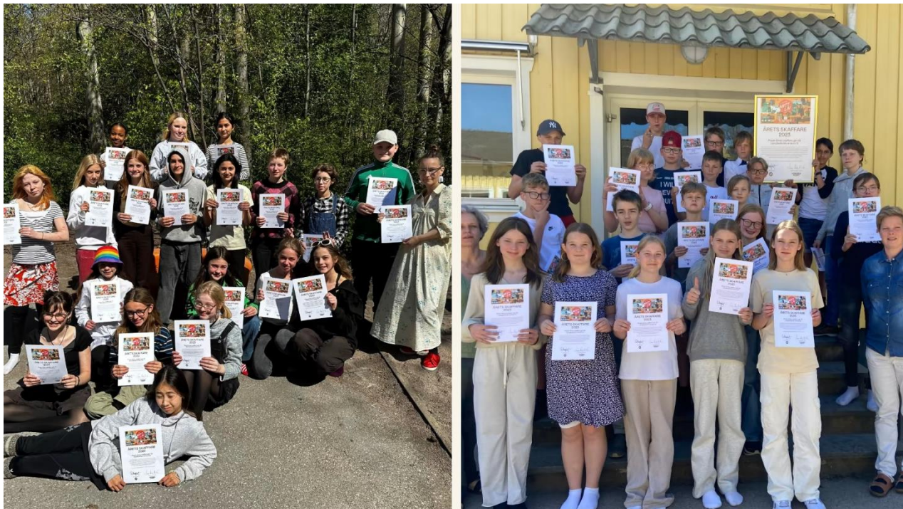
Figur 1 - Vinnarna av Årets skaffare 2023. Till vänster: Klass 6 Entréskolan, Stockholm. Till höger: Klass 6 Ljungbyskolan, Falkenberg.

Om du och din klass börjar dokumentera era liv och skickar in detta till museet har ni chansen att vinna priset 2025 (sista datum att delta är den 28 februari 2025).